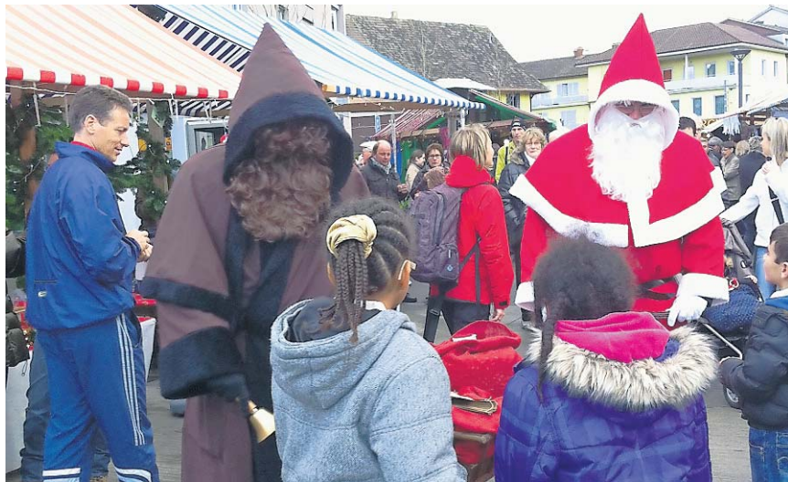
Samichlaus und Schmutzli zirkulieren zwischen den Marktständen.

Die ganz Kleinen dürfen sich derweil von der Eisenbahn über den Marktplatz chauffieren lassen und der Samichlaus samt Schmutzli ist von 11 bis 17 Uhr präsent – nicht nur um Verslein und Lieder abzuhören, sondern auch um Mandarinen, Nüsschen und Schokolade zu verteilen. Dazwischen übernimmt das Duo die Preis-